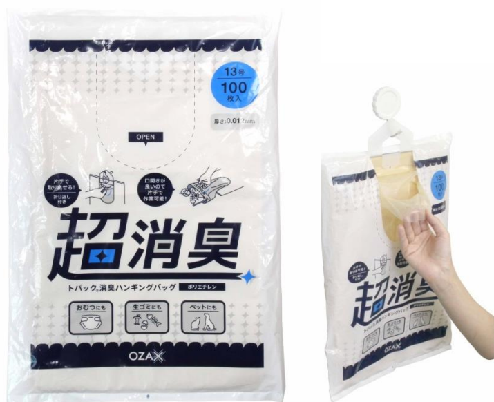
トパック消臭ハンギングバッグ