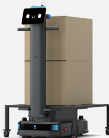
リフティングモード