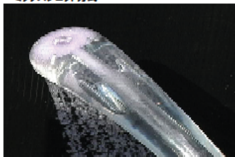
・ミックスジェット方式